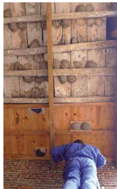
Nesten onder dak