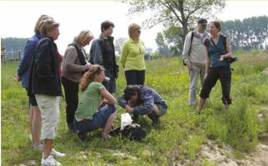
▲ Streekbewoners genieten van het uitzicht op een poel in natuurgebied Kollinten.

Poelen zijn vaak pareltjes van biodiversiteit. Vroeger deden ze dienst als veedrinkplaats of vlasrootput voor de linnenproductie. Maar de laatste jaren wordt het aantal poelen in ons landschap spijtig genoeg steeds kleiner.