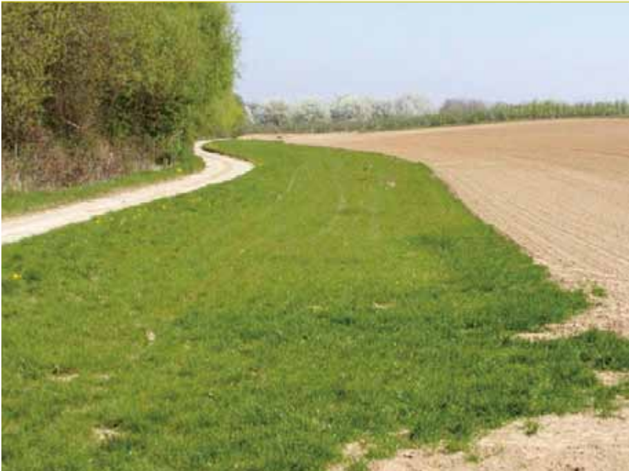
▲ Grasstrook tussen houtkant en akker als buffer voor bestrijdingsmiddelen, meststoffen en bodemdeeltjes.