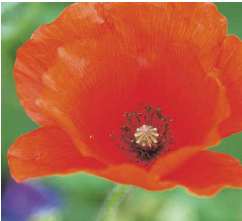
▲ De oogverblindende schoonheid van een klaproos.